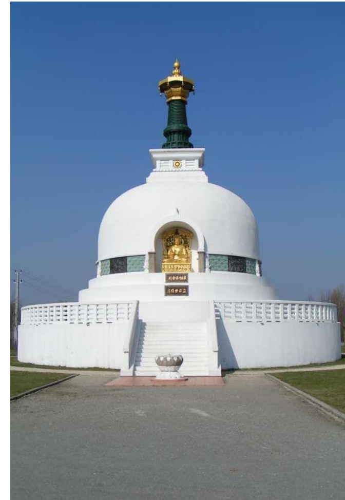
FRIEDENSPAGODE IN WIEN

Ein Stupa (oder eine Pagode) ist der konkrete Ausdruck des immerwährenden Dharma. Der fesselnde Vorgang der kosmischen Manifestation und seiner Wiederauflösung durch mystisches Wissen in die allerhöchste Wirklichkeit wird durch einen Stupa versinnbildlicht. Grundriss und Aufbau eines Stupa werden durch das Unterbringen von Reliquien des Buddha geheiligt. Die Philosophie und das Ziel hinter der Errichtung solcher Friedens-Pagoden ist es, unter Menschen Liebe und Frieden zu verbreiten und damit die Botschaft von Mitgefühl und friedlicher Koexistenz zu verkünden.